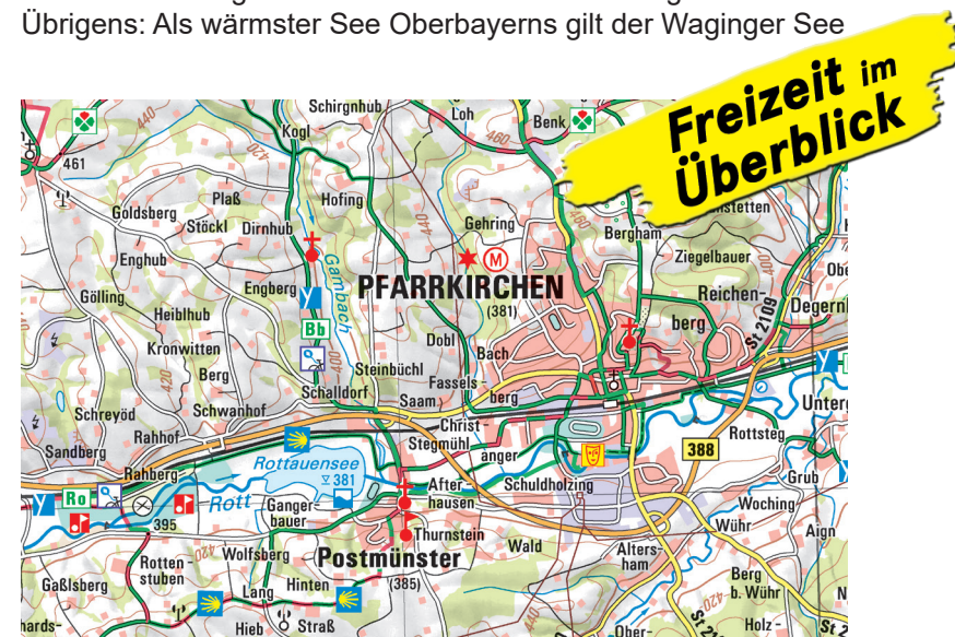
Ausschnitt aus ATK100-15 Rottal - Inn

Erstklassige Erholung verspricht das Rottaler Bäderdreieck. Bad Füssing, Bad Griesbach und Bad Birnbach bieten mit der heilenden Kraft des Thermalwassers die besten Voraussetzungen für einen Wellness-Urlaub. In der Dreiflüssestadt Passau mit seiner historischen Altstadt und dem Dom mit der weltgrößten Kirchenorgel kommen Kunst- und Kulturliebhaber auf ihre Kosten. Die Freizeitparadiese Bayernpark und Erlebnispark Voglsam locken Familien genauso wie das beliebte Salzburger Seenland. Übrigens: Als wärmster See Oberbayerns gilt der Waginger See