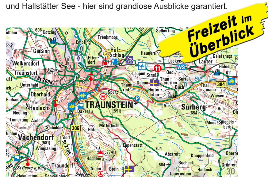
Ausschnitt aus ATK100-19 Chiemgau

Ein besonderes Erlebnis ist eine Radtour auf einem der vielen Bayernnetz-Radwege, wie dem Bodensee-Königssee-Radweg oder dem Panoramaweg Inn-Salzach. Hier radeln Sie durch Wiesen und Moore entlang von malerischen Seen und Flüssen. Wanderer erleben die Natur der Voralpenlandschaft auf dem Voralpinen Jakobsweg oder dem St. Rupert-Pilgerweg und machen gerne Rast an einem geselligen Gasthof oder einer urigen Alm. Hoch hinaus führen der Europäische Fernwanderweg E4 mit seiner alpinen Variante oder der SalzAlpenSteig zwischen Chiemsee und Hallstätter See - hier sind grandiose Ausblicke garantiert.