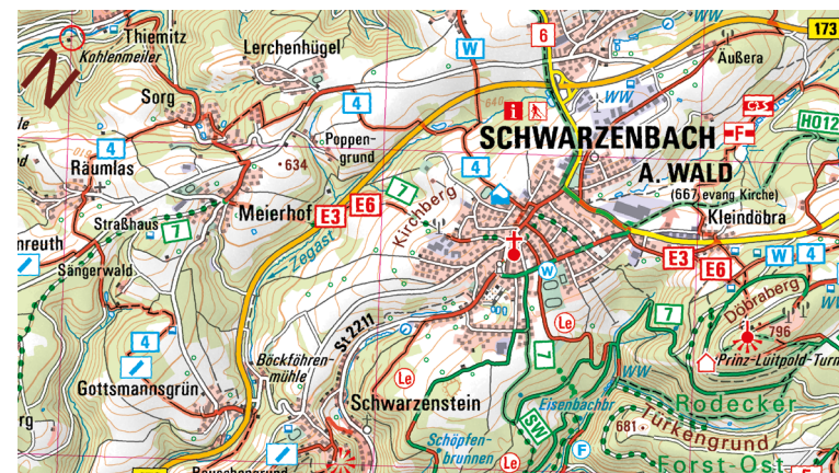
Ausschnitt aus UK50-4 Naturpark Frankenwald

Der Frankenwald bietet vielfältige Entdeckungsmöglichkeiten abseits des Massentourismus im Herzen Deutschlands. Familien verbringen einen schönen Tag in der Bergbau-Erlebniswelt Kupferberg oder im Tiergarten Sonneberg. Unvergessliche Erinnerungen sammelt man auf einer Floßfahrt auf der wilden Rodach in Wallenfels. Badespaß bieten das Erlebnisbad Crana Mare in Kronach oder die Thermo Bad Steben.